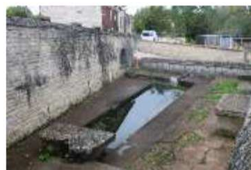
La montée vers le vieux village de Bourrier