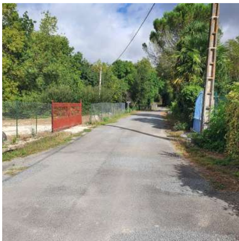
VC Merlageau à St Fraigne