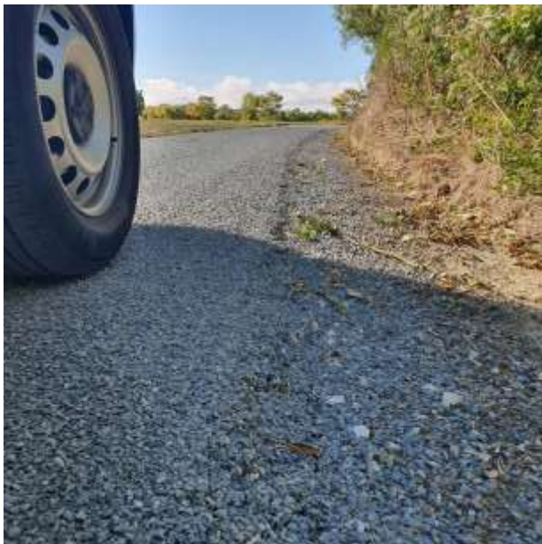
VC Galard à Ranville - Rive