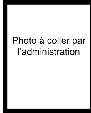
Photo à coller par l'administration