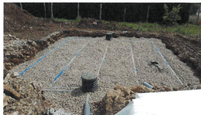
Filtre à sable vertical non drainé