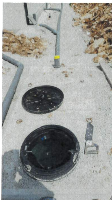
Fosse toutes eaux