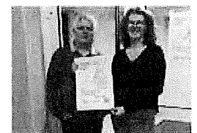
Faguss'Art, des créateurs de choix à ne pas manquer. CL

Devant la réussite et la satisfaction unanime des organisateurs et des visiteurs, le club de La Faye « Générations Mouvement » reconduit Faguss'Art, l'exposition artisanale de qualité ne recevant que des artisans professionnels et auteurs locaux. Faguss'Art se tiendra le dimanche 9 février, dans la salle polyvalente de La Faye de 10h à 17h30. Les visiteurs admireront les créations d'une dizaine d'artisans d'art locaux : abat-jour, bijoux, gravures, enluminures, vitraux, marqueterie sur paille, bois tourné et sculpté, bois flotté, meubles peints, sculptures sur métal, généalogie. Au total, huit artistes peintres et aquarellistes et quatre auteurs. Certains feront des démonstrations de leur savoir-faire. L'entrée est libre et gratuite.