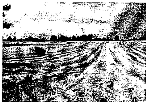
Balles rectangulaires de 400 kg : 19 à 23 euros la balle