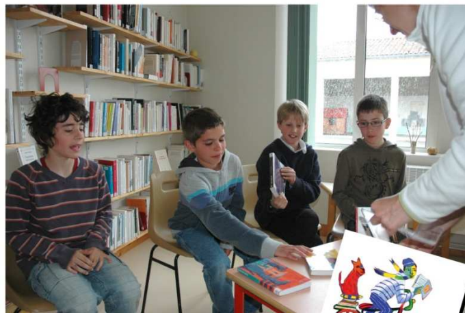
Réunion du jury pour le Prix des Incorruptibles