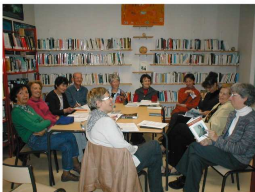
Vote du Comité de Lecture pour le Salon de la littérature Européenne de Cognac. Cette année, la Belgique était à l'honneur;