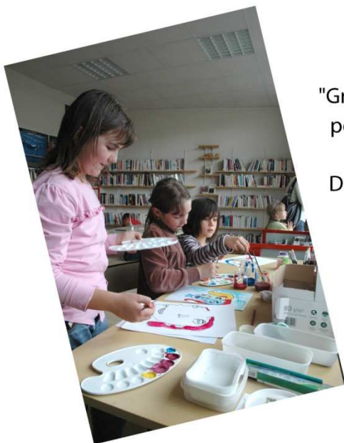
Animation "Graines d'Artistes" pour les 6/12ans

Des oeuvres en bonbons à dévorer des yeux !