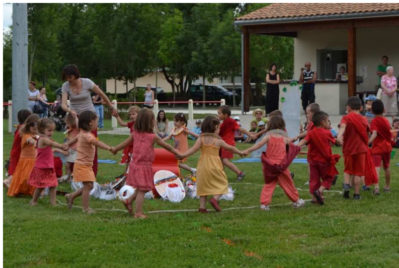
Kermesse 2012 – Classe des TSP/PS

Toute l'équipe de l'A.I.P.E. vous souhaite une bonne et heureuse année 2013.