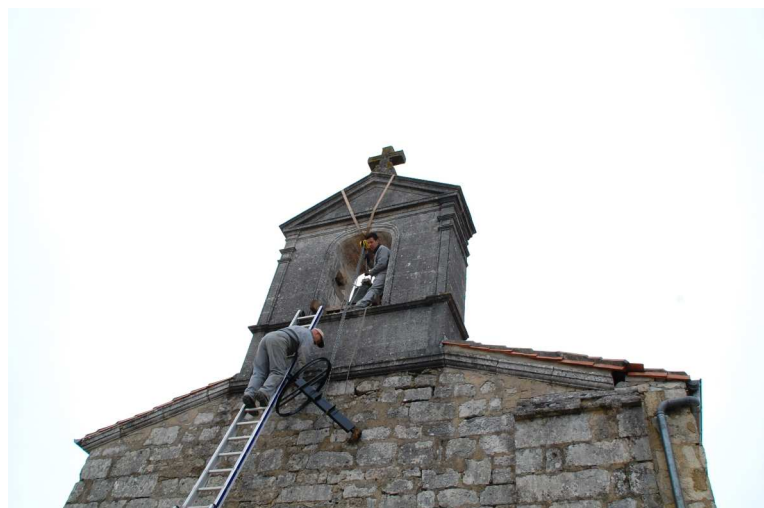
Remise en état de la cloche