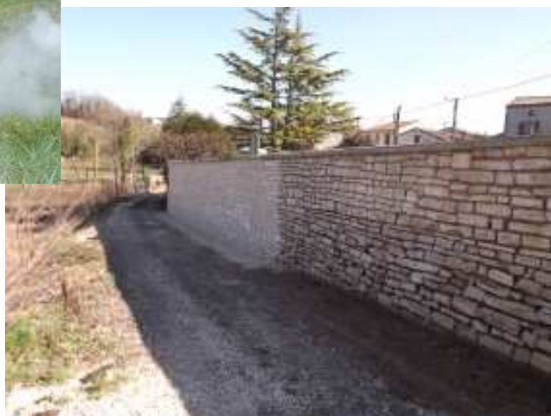
Le mur de Vadalle en cours de rénovation