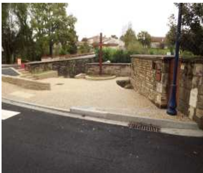
La zone des bassins à Ravaud