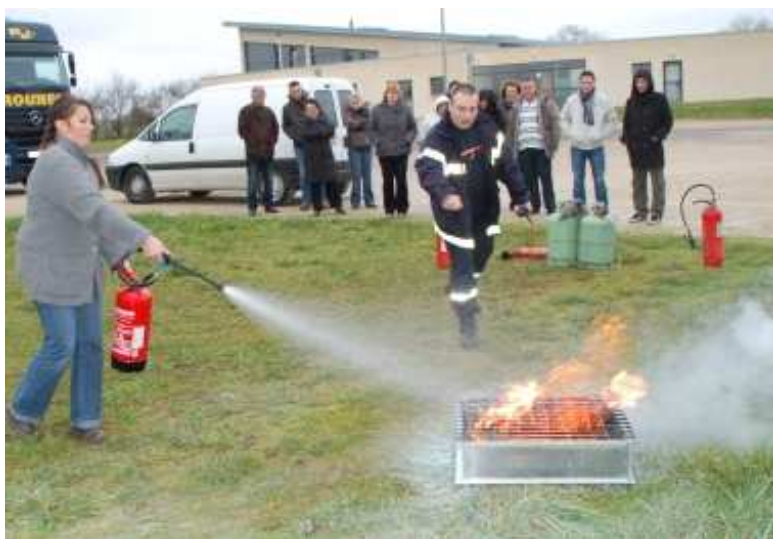
Formation lutte contre l'incendie