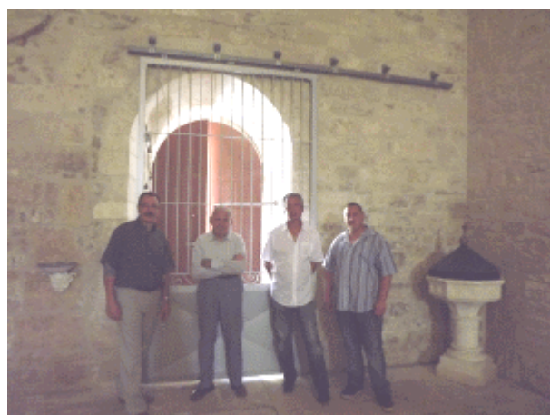
Pose de la grille