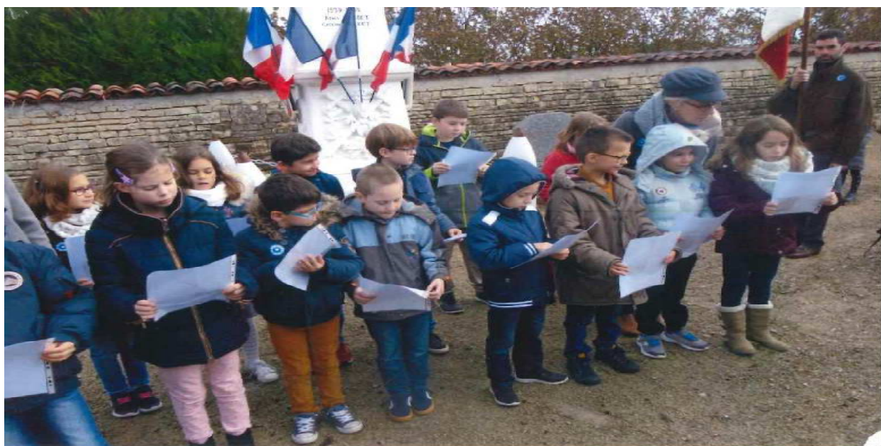
Lecture de poèmes par les enfants de l'école de Vadalle

A ce titre, elle participe très activement au côté de la municipalité, aux cérémonies organisées en l'honneur de tous les soldats tués lors des deux dernières guerres mondiales 8 mai-11 novembre et la guerre d'Algérie, et au cours des événements du 19 mars et 5 décembre. Mais aussi pour les opérations extérieures avec les enfants et les enseignants de l'école de Vadalle, le lundi 11 Novembre ils ont lu des poèmes et chanté La Marseillaise.