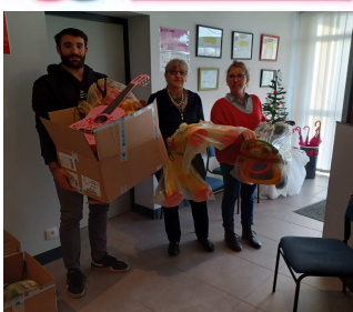
Participation à la collecte de jouets organisée par l'école de commerce d'Angoulême.