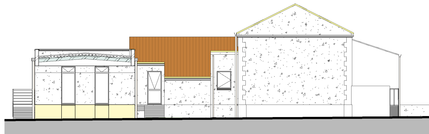
ECOLE-FACADE OUEST 1 : 150