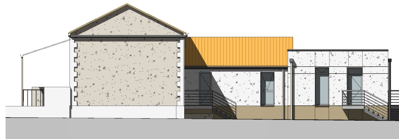
ECOLE-FACADE EST 1 : 150