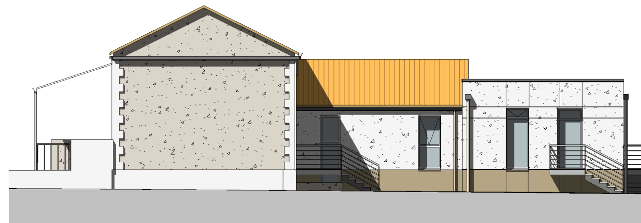
ECOLE-FACADE EST 1 : 150

Projet: AMENAGEMENT D'UN RESTAURANT SCOLAIRE AUSSAC VADALLE