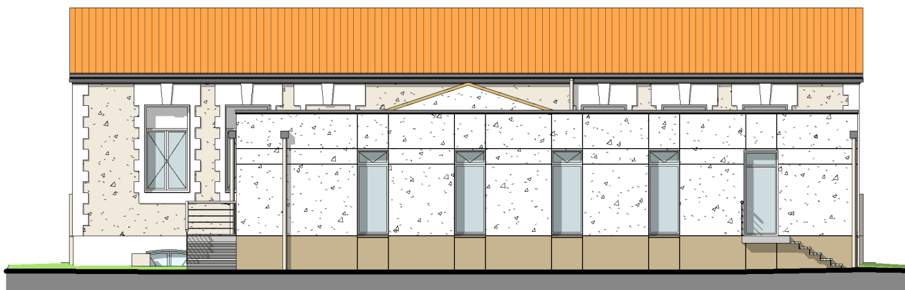
ECOLE-FACADE NORD 1 : 150