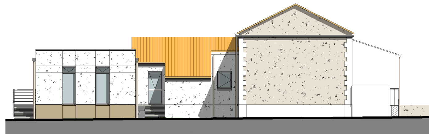
ECOLE-FACADE OUEST 1 : 150