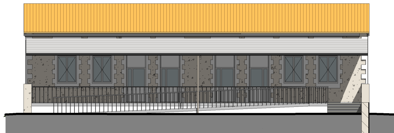
ECOLE-FACADE SUD 1 : 150