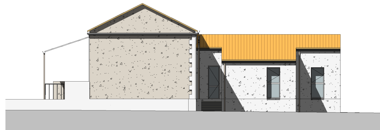
ECOLE-FACADE EST 1 : 150