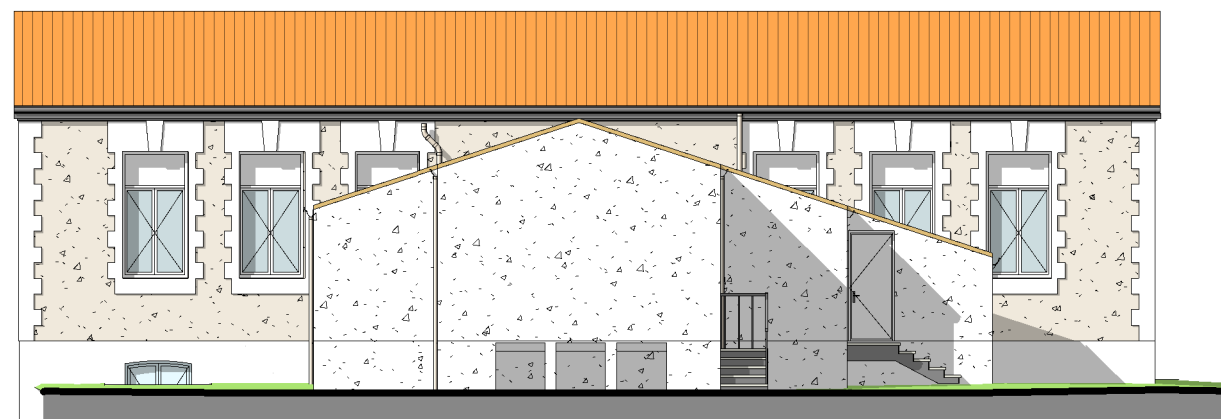
ECOLE-FACADE NORD 1 : 150