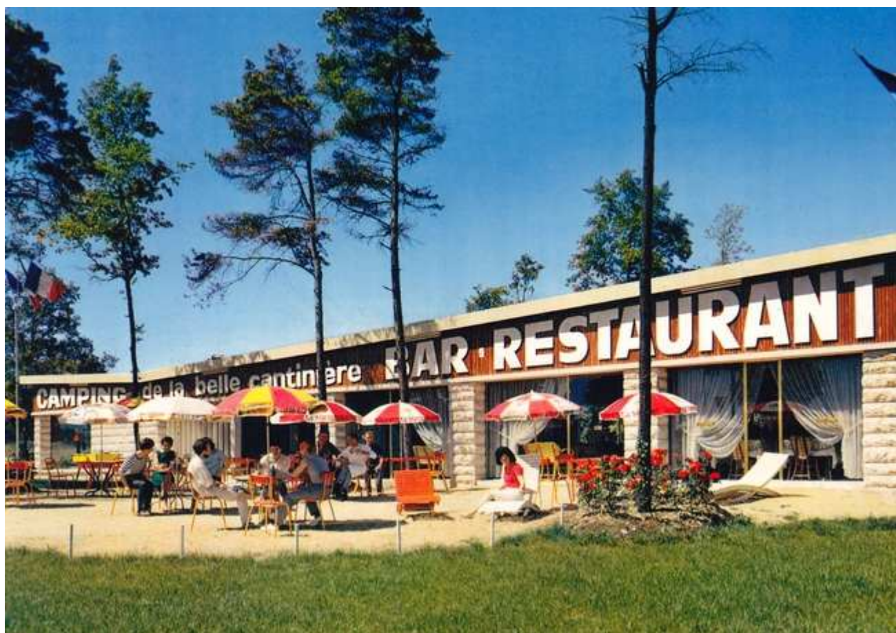
Quel plaisir de déguster une Slavia à l'ombre des parasols avant de reprendre la route !