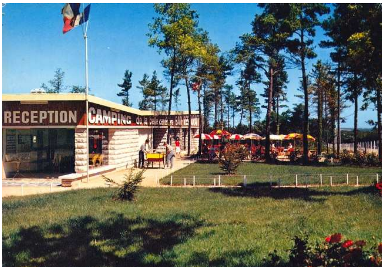
Alors que certains se prélassent, les plus sportifs s'adonnent à une partie de baby-foot en plein air.