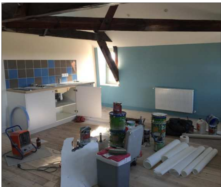
Sous les combles, un T4 de 91 m 2 sera mis en location.

*Sous réserve d'une zone desservie par portage et de l'accessibilité à votre boîte aux lettres.