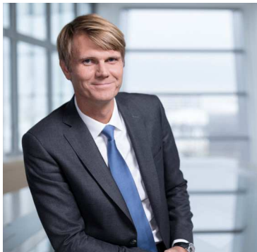
ÉDITORIAL Frédéric Gardès