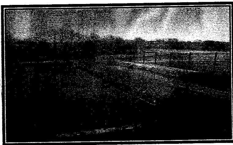
Lagune, qui recueille les eaux de lavage