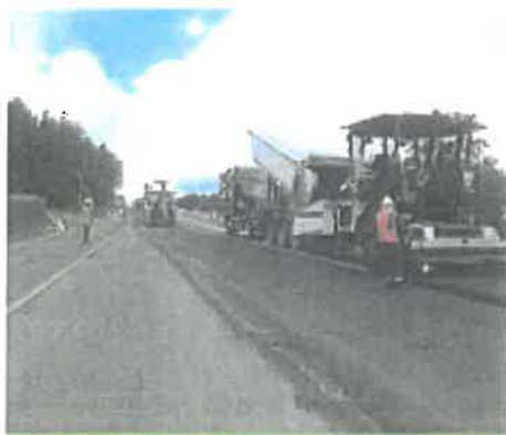
Mise en œuvre de l'enrobé