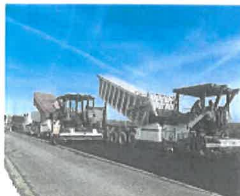
Mise en œuvre de la grave bitume