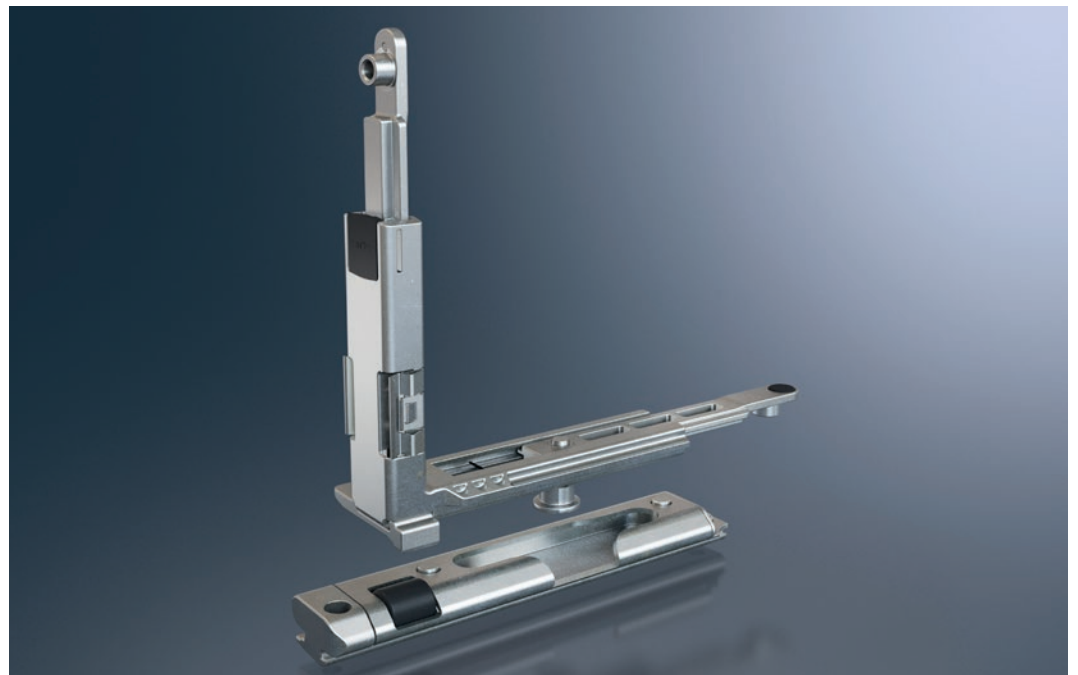
Nouveau système de renvois d'angles intégrant verrouillage et butée support