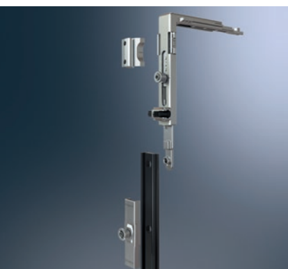
Système anti-fausse manœuvre