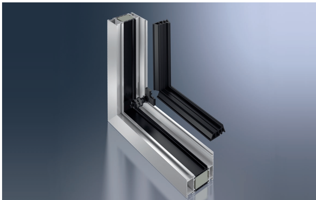
Joint central continu

SimplySmart révolutionne l'étanchéité avec un nouveau système de joint central continu, développé à partir de caoutchouc micro-cellulaire, dont la forme s'adapte parfaitement au profil de la fenêtre.