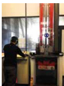
Test au choc