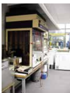
Test au feu