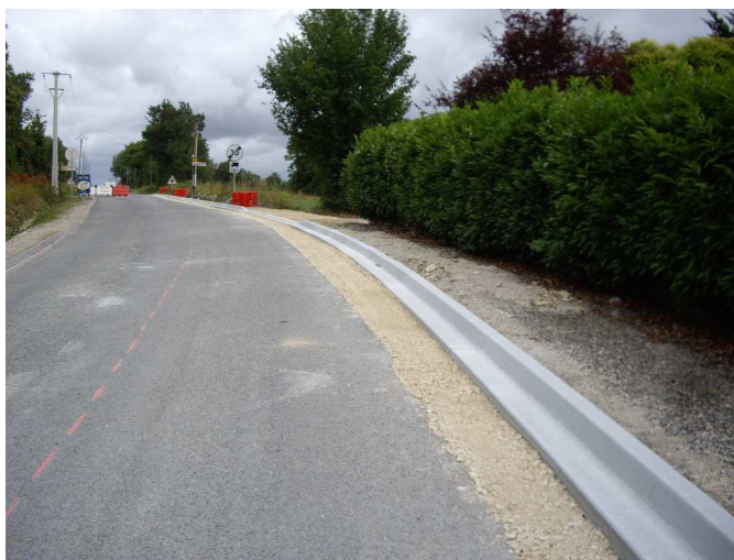
Entrée côté Mansle - 11/07/2012