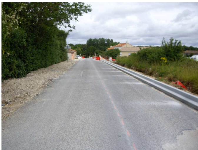
Entrée côté Coulgens - 11/07/2012