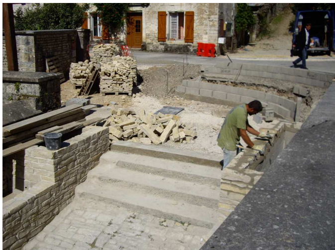
Zone bassin - 25/07/2012