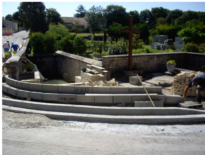
Zone bassin - 25/07/2012