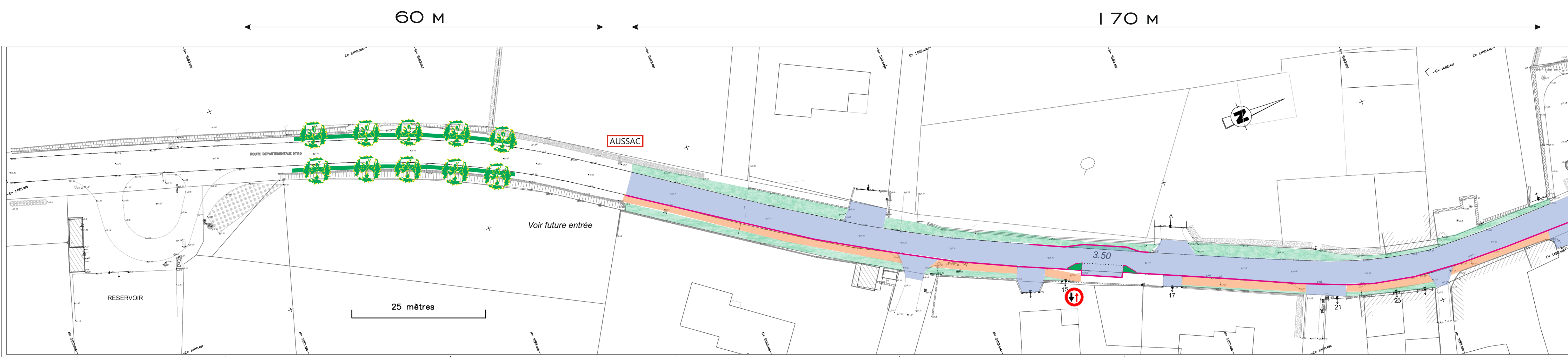
1 organe réducteur de vitesse : circulation alternée