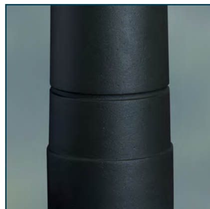
(illustrations ci-dessus : peinture givrée)