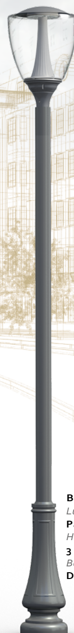
BELLE EPOQUE Luminaire : Palma Hauteur : 3 m. Borne : Dervois GM