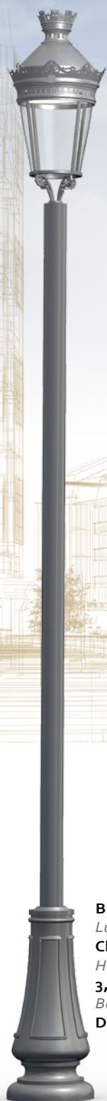
BELLE EPOQUE Luminaire : Chenonceaux II Hauteur : 3,50 m. Borne : Dervois PM