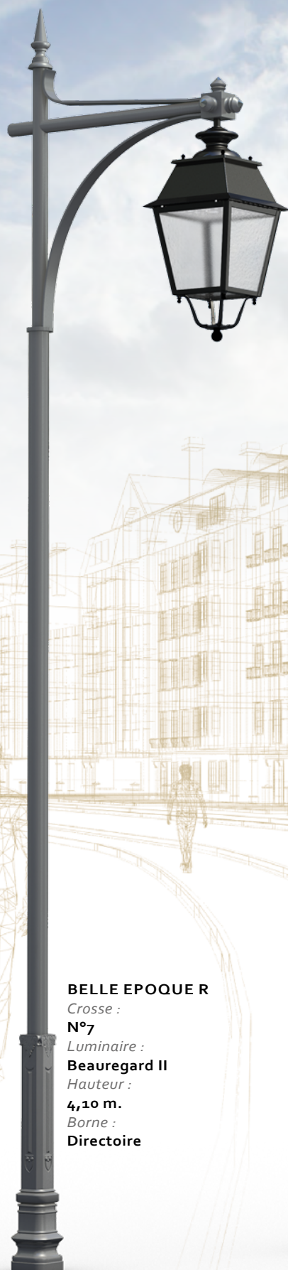
BELLE EPOQUE R Crosse : N°7 Luminaire : Beauregard II Hauteur : 4,10 m. Borne : Directoire