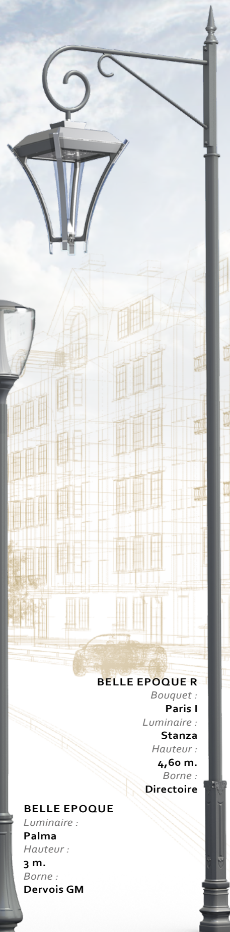
BELLE EPOQUE R Bouquet : Paris I Luminaire : Stanza Hauteur : 4,60 m. Borne : Directoire