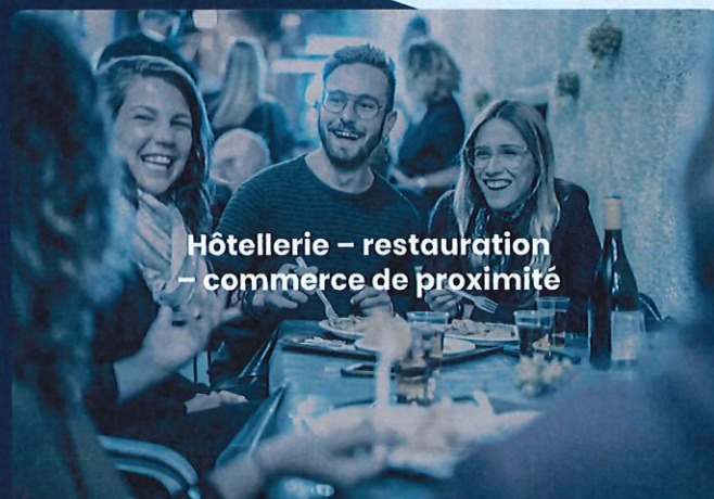
Hôtellerie – restauration – commerce de proximité