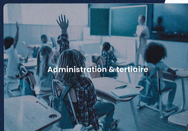
Administration & tertiaire