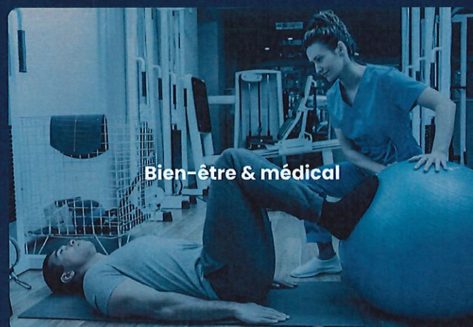
Bien-être & médical

Aquasine est spécialement conçu pour répondre aux normes les plus strictes du secteur professionnel et sera parfaitement adapté pour :